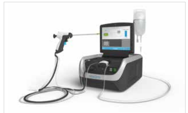
REZUM™-Gerät (Hersteller: Boston Scientific)

Der Eingriff erfolgt mit örtlicher Betäubung oder in Vollnarkose im Rahmen eines kurzen, stationären Klinikaufenthaltes.