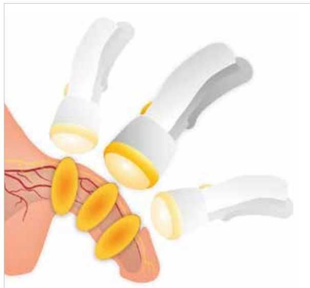
Das Gerät wird nur oberflächlich angewendet, wobei Stosswellen in die zu behandelnden Bereiche gesendet werden.

Die Behandlung kann zudem ein Remodeling von penilen Plaque induzieren, d.h. das verkalkte Narbengewebe im Bereich der Schwellkörper kann sich neu formen. Dies kann zu einer Schmerzlinderung in der akuten Krankheitsphase einer Penisverkrümmung beitragen.